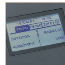
Display mit Hintergrundbeleuchtung