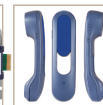
Optionales schnurloses Mobilteil