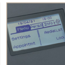
Display mit Hintergrundbeleuchtung