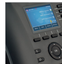
Display mit Hintergrund-