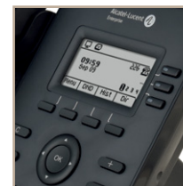
Display mit Hintergrund-